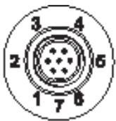
Binder 723 (7-конт.)