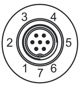
Binder 723 (7-конт.)